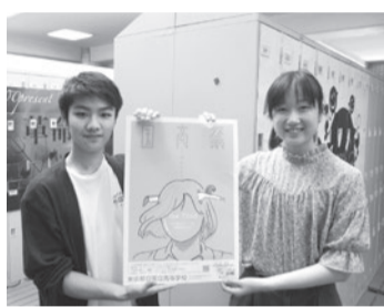
国高祭のポスターを持つ2人

最後に「勉強・行事・委員会・部活動、全て頑張りたい生徒に向けている高校です。」「気の合う仲間もたくさん出来ます」と国高について2人は話してくれた。