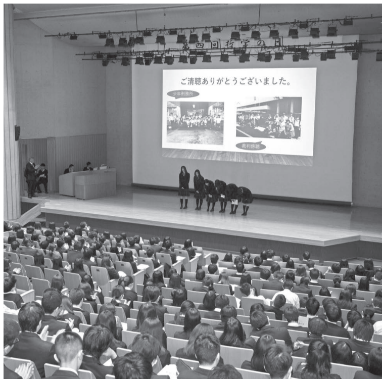
「哲学の日」―哲学教育プログラムにおける1年間の学びを共有し合う一日。

①大学進学実績の躍進。②国際社会に対応した教育として、国際理解と国際英語の授業を設定。③国際的視野を持つための短期留学体験の実施。海外での英語研修の充実。④チューター制を取り入