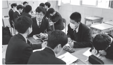
先輩の体験談を聞く熱心に聞く(2020年2月撮影)

さらには、昭鉄OBの先輩たちは夜勤明けであっても学校に来てくれて様々な体験談を話してくれまして、付け加えた。まさに、先輩たちの後輩への思いが良き伝統として繋がって、厳しい就職試験を乗り切る原動力となっている。