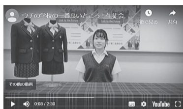
生徒会からの「ウチの学校のイチバン良いところ」

役員4名が「女子だけでなく気を配らないので体育祭・文化祭が楽しく強い絆を感じます」などと優しく語りかけてくれる。