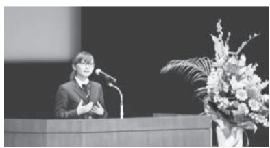
英語・外国語スピーチコンテストの本戦の様子