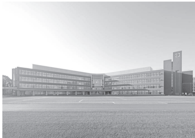
最新設備がそろった築4年の新しい校舎。広大な校庭は全面人工芝。学習環境は群を抜いている。