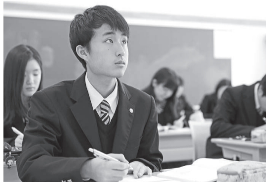
学業にも行事にも積極的かつ真剣に取り組む生徒たち。

また、アメリカ、フィリピン等への語学研修やホームステイ、英語コンテストや数学オリンピックへの参加など多様な実体験を通して、スケールの大きな国際人を育成している。