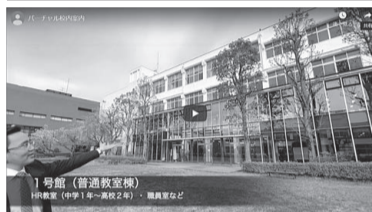
バーチャル校内案内動画

と決めたそう。まずは、「バーチャル校内案内動画」で自慢のキャンパス紹介を公開した。本来であれば在校生がキャンパスツアーで案内してくれる企画だが、休校中なので先生が隅々まで校舎を紹介している。実際に見学に訪れた、是非自分の目で確かめておきたい。