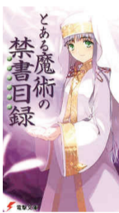
『とある魔術の禁書目録』

皆さんは超能力を使いたいと思っただけではありませんか？今回紹介する本は、科学的に超能力を開発することに成功した街で主人公が事件を解決するために東奔西走する物語です。能力者はその能力の強度により0から5までの6段階に分けられています。その頂点であるレベル5の能力者には、発電・未知の素粒子の操作・体表面にふれたもの全てのベクトルを操るなどの能力があります。理数系にあまり興味なかった文系の私でも、この本を読んで理系分野に関心を持つようになりました。