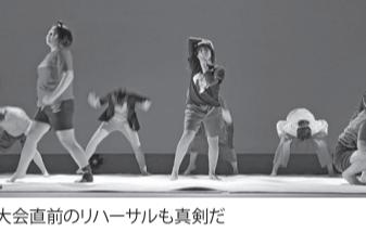
大会直前のリハーサルも真剣だ

「私たちが頑張る理由は、先輩たちの指導があったから。今度私たちが頑張る理由は、先輩たちの指導があったから。今度私たちが頑張る理由は、先輩たちの指導があったから。」