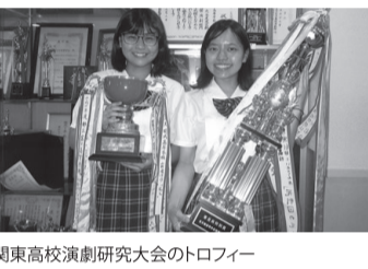
関東高校演劇研究大会のトロフィー

「私たちが頑張る理由は、先輩たちの指導があったから。今度私たちが頑張る理由は、先輩たちの指導があったから。今度私たちが頑張る理由は、先輩たちの指導があったから。」