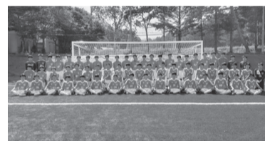
拓大高一サッカー部イレブン