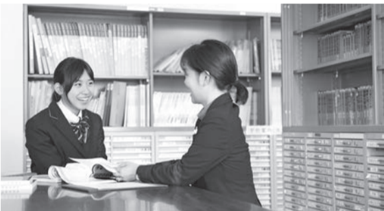
生徒一人ひとりに合わせた指導を行う

最後に「各大学の受験情報を把握し、生徒の得意分野や一押しポイントを最大限受験に活かす指導を行っています」と力強く話してくれた。