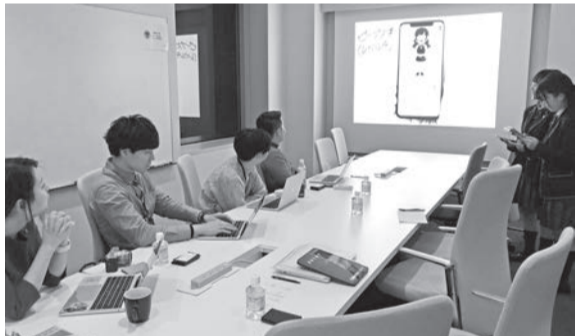
探究学習で企業でプレゼンする生徒たち ※協力: モンスターラボ社

同校は今春、元都立高校校長の吉田巨先生を新校長に迎えました。吉田校長は、同校の歴史と伝統を尊重しつつも、さらなる飛躍をめざすため4つのプログラムを提示しました。