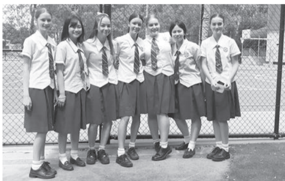
オーストラリア、ターム留学で現地の高校生と一緒に