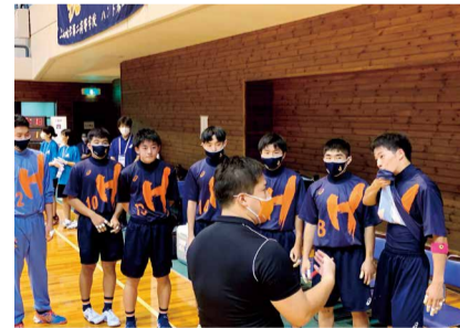
法政大学第二高校 ハンドボール部