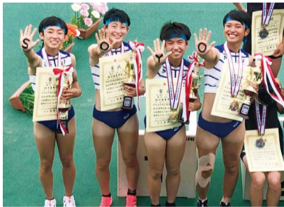
相洋高校 女子4×400mリレーメンバー