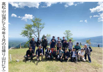
高松山山頂にて今年5月の日帰り山行の様子