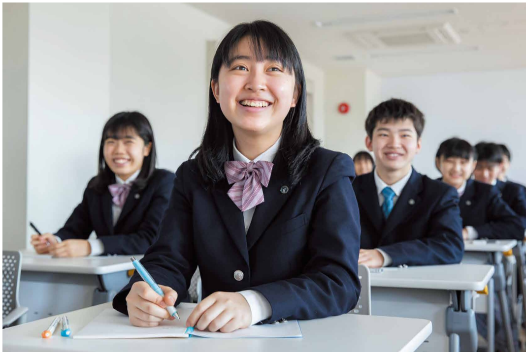
国語・数学・英語・理科の4教科は文理ごとに習熟度に分けて授業を実施