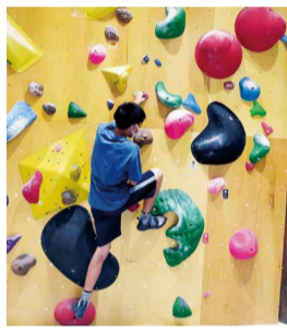
ボルダリングの練習風景

「部活動はクライミングと、山登りの実技と座学が基本です。現在はコロナ禍で、毎年行う3泊4日の夏山合宿は出来ませんが、今年の5月に丹沢を登った際には、暑さでバテ気味の時でも仲間と励ましあいながら登ったことや、下山の際に立ち寄った温泉や先輩や仲間たちと分け隔てなく話すことができ、絆を深めることが出来ました」と山岳部の魅力について語ってくれた。