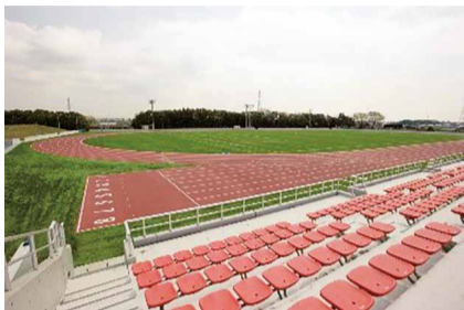
1200席の観客席のある人工芝グラウンド