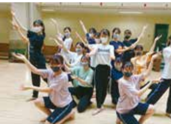
美しいフォーメーション、全員の息もぴったり

「小山台高校の文武両道は建前じゃなくて、ガチ、なんです。よ」と二人は笑みながら教えてくれた。「家でも練習するので時間の管理が大変だけれど、メ