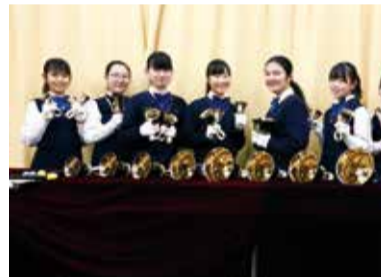
聖歌隊メンバーとハンドベル

練習では中高生が一緒にいる。先輩から後輩へハンドベルの振り方の指導や、イラストを描いたイメージトレーニングを通じて、心をひとつにしている。