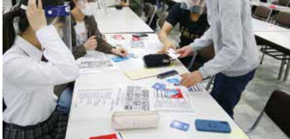
SDGsを学ぶグループワークの様子

後まで自分を高められる環境に向かつて頑張つて」と話してくれた。試験に臨んでは「基礎問題を落とさないことが大切だ」とのアドバイスも、参考にしたい。