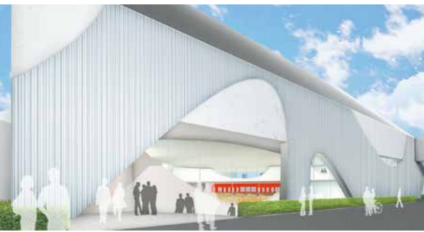
2022年夏 完成予定新校舎

各種実習施設が設置された6号館が完成する。道路を挟むが、階上に連絡通路を設け、生徒たちの安全確保を図るようだ。年々充実する最新設備生徒たちに寄り添う教育の進化は止まらない。