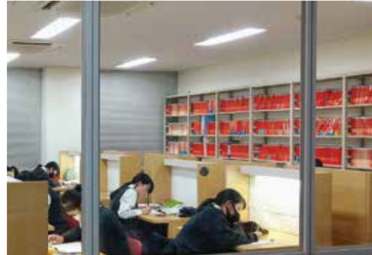
朝や放課後に、自習室を利用する生徒も多い

1年次は特別進学、総合進学の3コース制。2年進級時に志望や成績によるクラス分けによって特別進学、総合進学、共立進学、英語の4コース制になり、より生徒一人ひとりの目標に向けたきめ細かい学びを実施する。