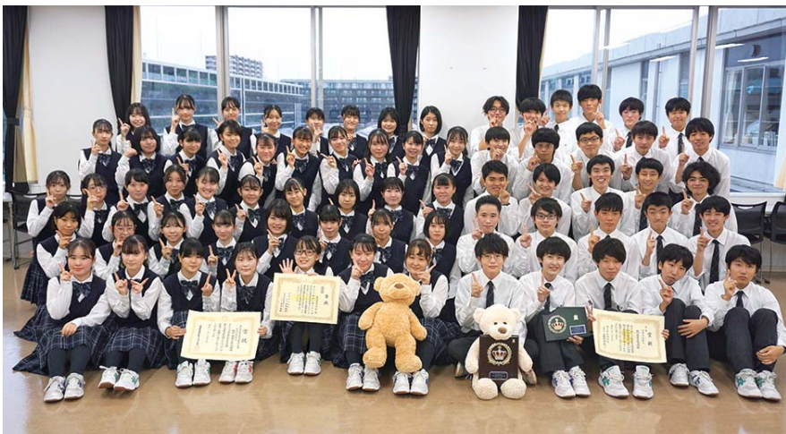
「Seize the day! (今を楽しめ!)」を合言葉に、部員が自主的に活動を行っている。部員は例年70人前後。今年度は第74回全日本合唱コンクール全国大会金賞、NHK 全国学校音楽コンクール関東甲信越ブロックコンクール銀賞を受賞。

選択しましょう。まず、本番までやるべきだと考えられることを列挙してみてください。頭の中で考えるのではなく書き出してみてください。他人との約束ではないので、後で足したり引いたりしてもいいことにしましょう。分らないときはひとりで悩まず先生に相談しましょう。