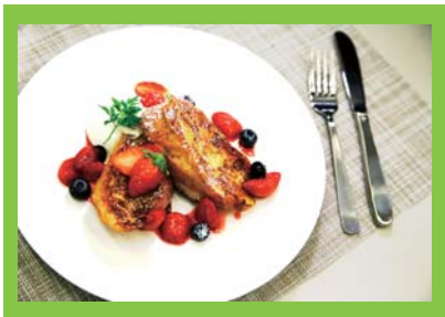
監修：国際共立学園高等専修学校 製菓衛生師・調理師科 職員