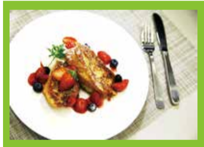
監修：国際共立学園高等専修学校 製菓衛生師・調理師科 職員