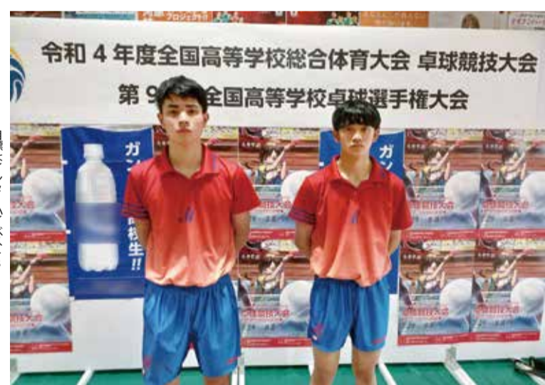
目標はインターハイベスト8