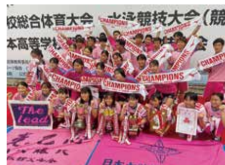
日本大学藤沢高校 水泳部