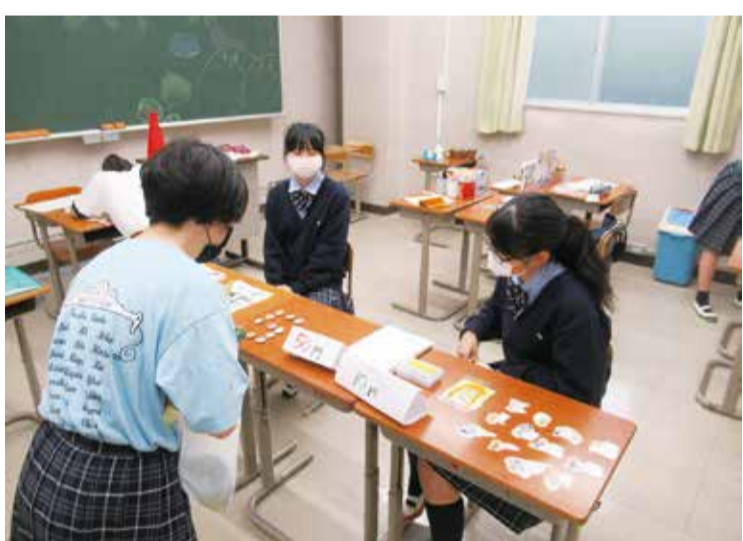
昨年の文化祭での販売の様子