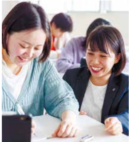
「オンライン+通学」スタイルで、自分のペースで学べるコースもあります。