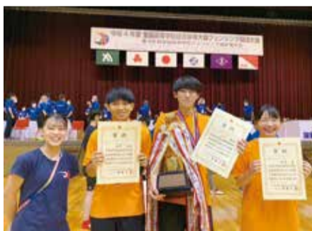
法政大学第1高校 フェンシング部