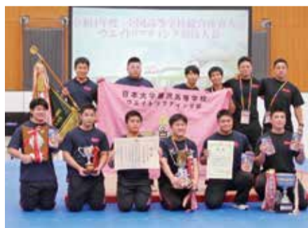
日本大学藤沢高校 ウエイトリフティング部