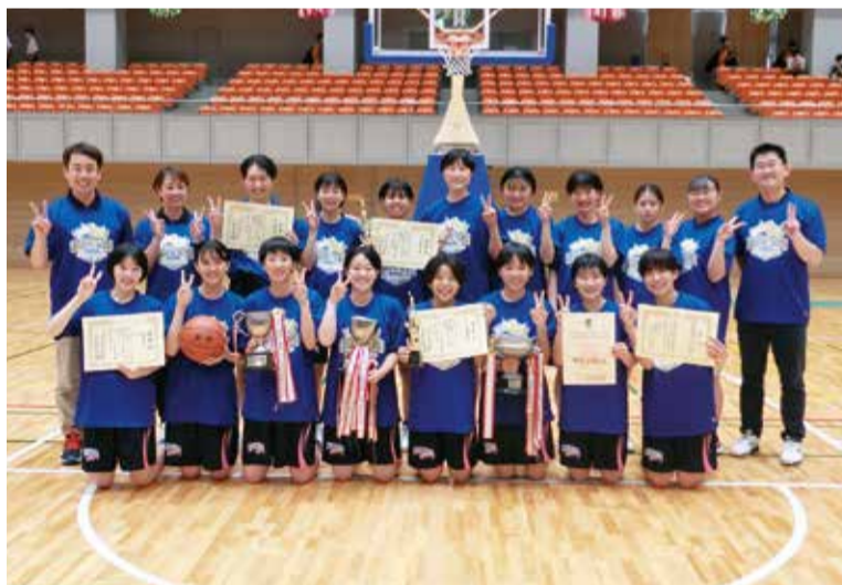
試合を終え、笑顔がまぶしいチームメンバー

先生方は生徒たちに熱心に向き合い、面談の機会を数多く設け、勉強や進路にきめ細かく相談に乗ってくれる。自然環境に恵まれ、藤沢駅から江ノ電で2駅という地の利の良さもあり、多くの中学生から注目を集めている。