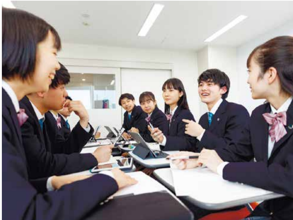
クラーク国際には協働して学ぶ探究型の授業や活動が盛りだくさん。