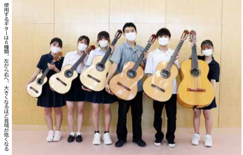
使用するギターは6種類。左から右へ、大きくなるほど音域が低くなる