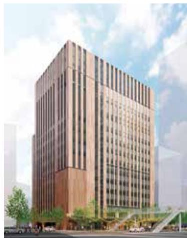
インターナショナルスクールも併設される、次世代型の新校舎

また、全国規模の模擬試験を実施し、一般入試に対応。一方で小論文対策の授業を選択できるようにするなど、国立大学の総合型選抜にも備えていく。同校の学校説明会は毎月開催中。HPで日程をチェックし、さらに詳しい話を聞いてみてはいかがだろうか。