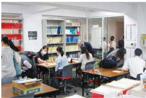
いつも明るく賑やかな進路指導室

進路指導は入学時から一段ずつ積み上げ、学習意欲を高める仕掛けを随所に設定していく。また都内でも数少ない普通科美術コースを持つ同校。7割近くの生徒が美術大学への進学を希望している。中でも東京藝術