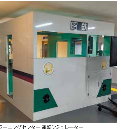
ラーニングセンター 運転シミュレーター