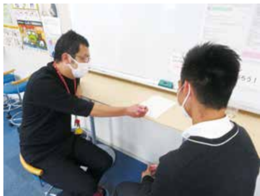
進路指導室での進路相談の様子

「文理コースについてはやはり、より難関の大学を目指すことが基本です。もちろん将来を見据えて探究的な学習やゼミナール方式などのカリキュラムもクラスに応じて用意しています。」