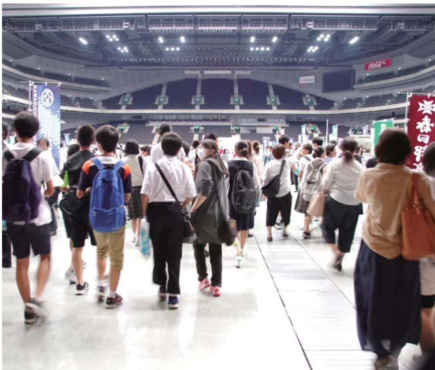
2023年7月15日・16日、彩の国進学フェア(公立・私立)が開催されます。写真は2019年の様子。