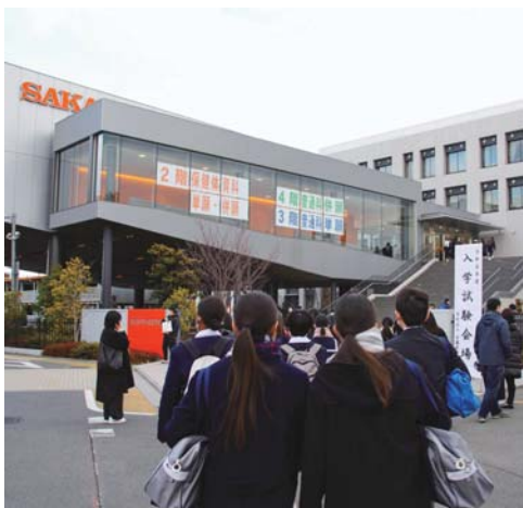
入試当日、埼玉栄高校の様子

このほか、淑徳と野が24%減、開智未来が45%減、細田学園26%減、狭山ヶ丘23%減、星野(女子部)28%減など、大幅に減った学校も多くありました。