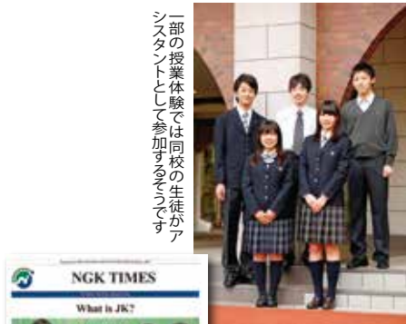
一部の授業体験では同校の生徒がアシスタントとして参加するそうです