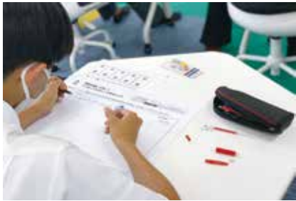
「ICT未来創造プロジェクト」ワークショップの様子