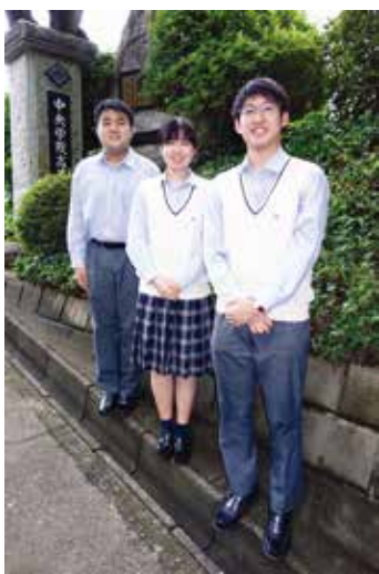
学校の入り口 通称「学院坂」の上で

中央学院高校は、8月19日・20日に学校見学会を実施しました。見学会では、各教室での学校紹介の後、部活動見学会や校舎見学などを行います。今年の注目ポイントは、生徒会メンバーによる質問コーナーと制服試着コーナーです。