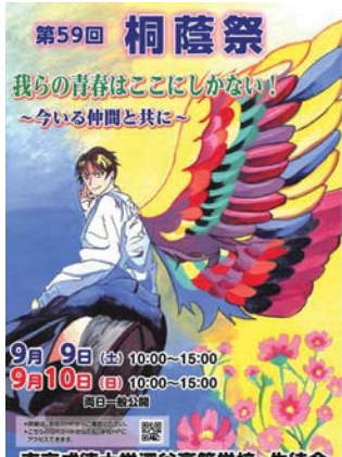
東京成徳大学深谷高校