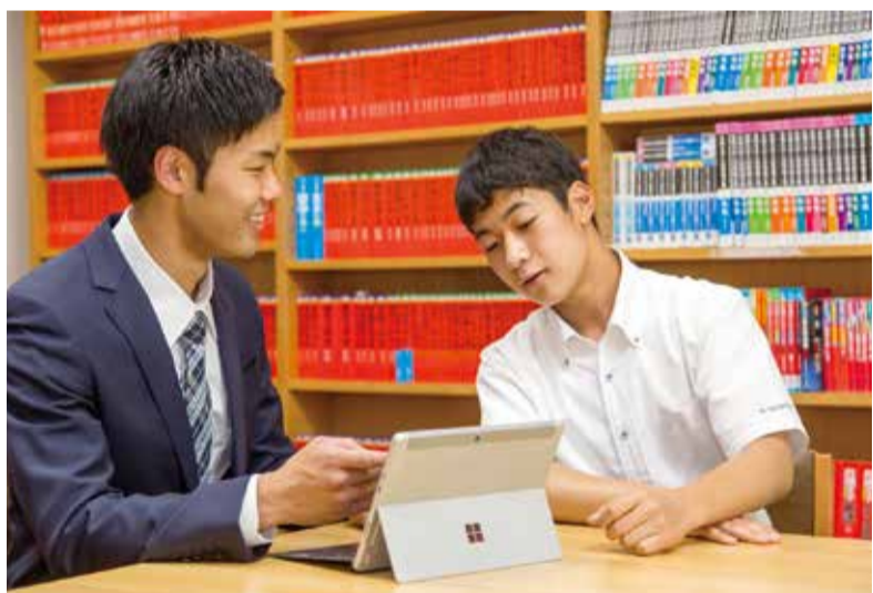
マンツーマンでの親身な進路指導が行われる