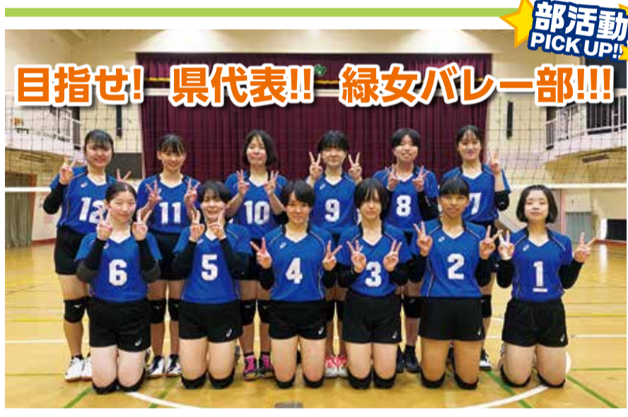
目指せ! 県代表!! 緑女バレー部!!! 緑ヶ丘女子高校 バレーボール部 緑ヶ丘女子高校バレーボール部です。新人戦、関東予選、インターハイ予選ともに県大会ベスト16まで進出することができました。「バレーボールが大好き」な選手たちが集まりました。「やらされるバレー」ではなく、「やりたいバレー」をレベルアップさせ県代表を目指して頑張っています。