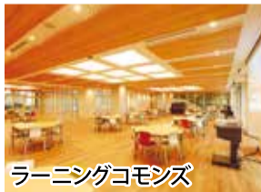
ラーニングコモンズ