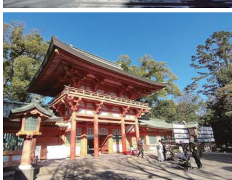
日本で一番長い参道や、朱色鮮やかな楼門など、見どころが沢山あります