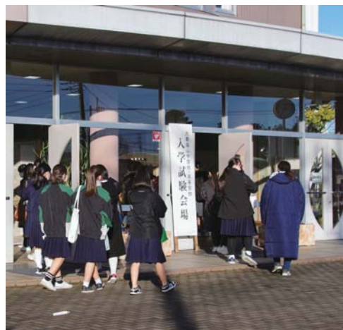
1月22日、大妻嵐山高校の様子

併願入試も志願者減が目立ちましたが、単願ほどではなく、前年度並みの志願者を集めた学校も多くありました。慶應義塾志木、早稲田大学本庄、栄東、立教新座などの難関校は数%の変動に過ぎず、淑徳与野川越東、獨協埼玉も大きな変動はありませんでした。そんな中で単願同様に見られました。早稲田大学本庄も同様で、287↓256↓230人の減少傾向から270人へと17%増えています。募集人員を増やした春日部共栄は開智の影響で13%増、開智未来は3倍増です。出願基準を緩和したことに加え、昌平が上げたことが拍車をかけたようです。城西大川越は山村学園からの移動があった