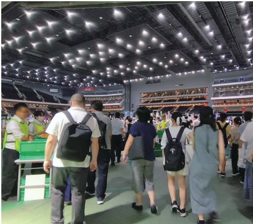
彩の国進学フェアの様子。今年は7月20日、21日に開催