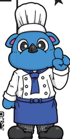
生徒会公式キャラクター:コックサイ

国際学院高等学校 KOKUSAI GAKUIN SENIOR HIGH SCHOOL