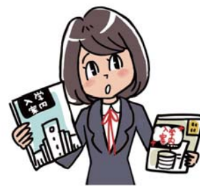
※4月22日現在 主催：読売新聞東京本社さいたま支局