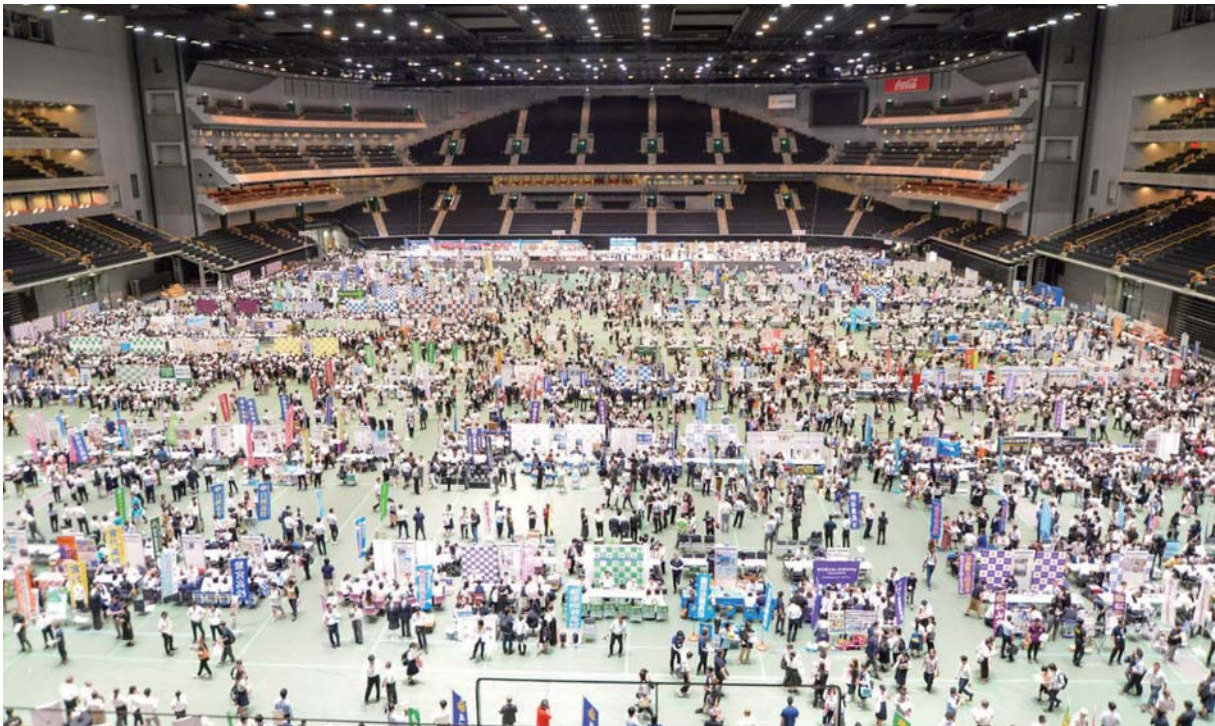
昨年の彩の国進学フェアの様子。今年度は7月11日・12日に大宮ソニックシティで開催