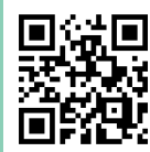
彩の国進学フェア ホームページ